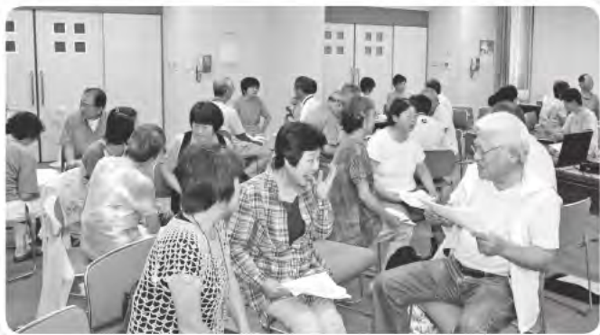
新しい活動に踏み出す場所! (くらし応援サポーター養成講座)