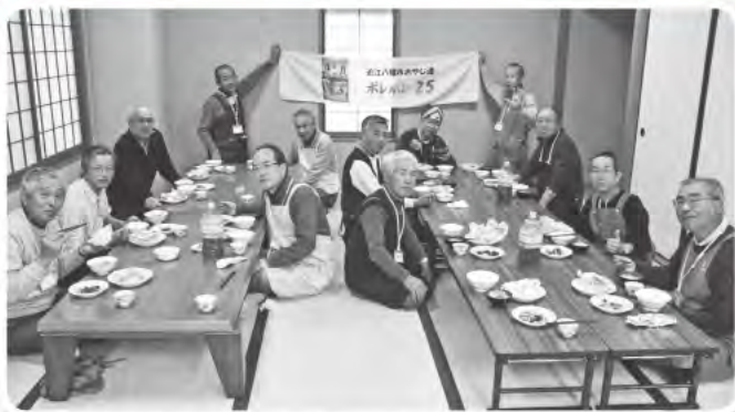
気の合う仲間と出会う場所! (退職男性の居場所づくり)

楽しさと感動の共有 ボランティア活動から得られるもの 楽しい、居場所、仲間、生きがいつけてみませんか?