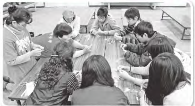
趣味や経験を活かして活動できる場所! (プレスレットの作り方指導でふれあい)