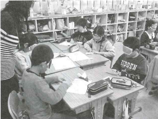
福祉学習「みえないことってどんなこと」(金田小)