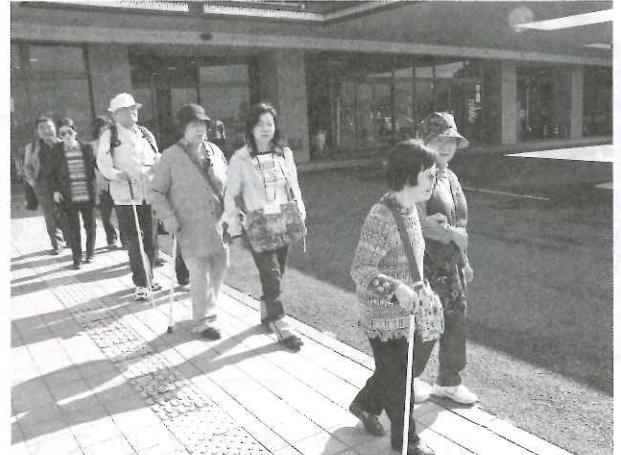
ガイドヘルパーの派遣(視覚障がい者支援)