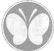
聴覚障がい者(車用)