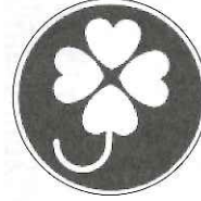
身体障がい者(車用)