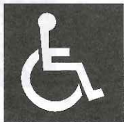
すべての障がい者