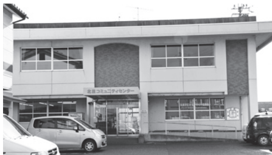
北里コミュニティセンターの外観