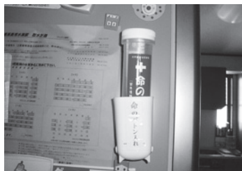
命のバトンは冷蔵庫の外に保管

当初は、設置場所をどこにするかを話し合い、誰でも目につき、毎日使用している冷蔵庫内設置を進めていましたが、中には衛生面・感覚的に嫌がる人もおられるので、再度検討して取り付け道具を使い写真のように運用しています。また、今までの課題として古いカルテでは誤診の恐れがあるため、新しいカルテに色づけを行っており、来年度は黄緑を台紙に使用しています。