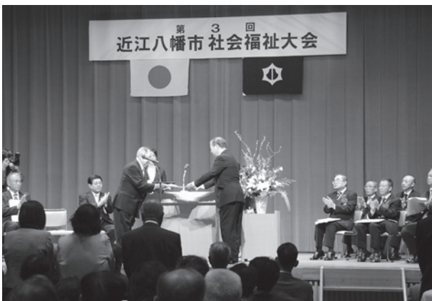
社協会長による表彰

この大会は、みんなで支えあいながら、安心して暮らせるまちづくりに永年取り組んできた方々に、感謝の意を表すために開催いたしました。