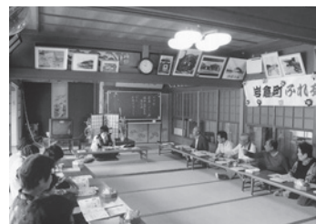
駐在さんよりお話

馬淵学区では、高齢者の楽しみの1つにふれあいサロンを毎月催しています。10月度のテーマは、秋の交通安全週間にちなんで駐在さんに来ていただき、交通マナーを学びました。内容は、歩行者編・自転車編・自動車編と教わり、話を要約すると高齢者になると自分の（認識と行動力）判断に大きなズレがある。その事を自分自身は気づかず、誤った行動をして事故を起こす。いかに日頃から意識した行動が事故防止に大切かを教わりました。