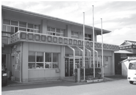
馬淵コミセンの外観