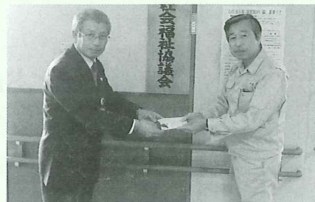
日本カーボン労働組合滋賀支部様