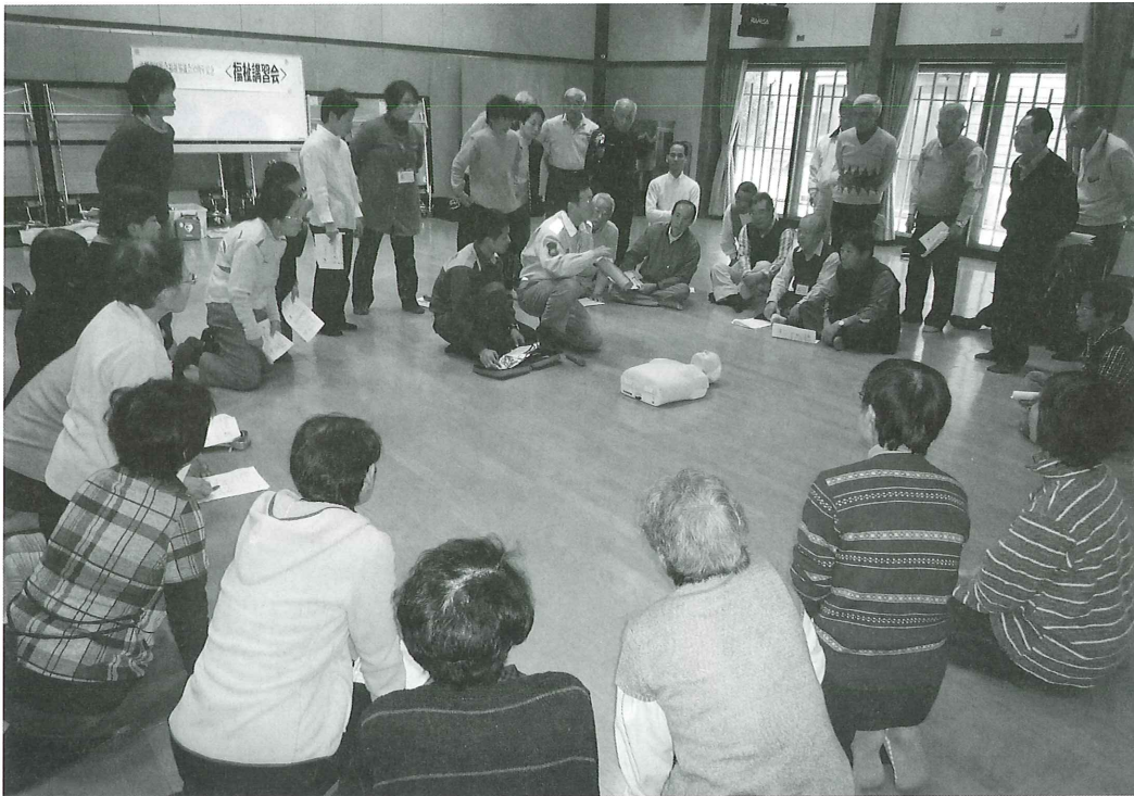
(2011年12月10日 講習会模様 近江八幡消防署員の指導)