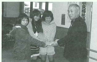
桐原学区子ども体験活動様