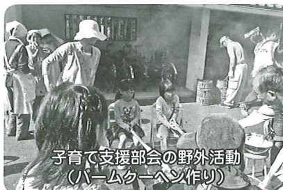
子育て支援部会の野外活動(バームクーヘン作り)