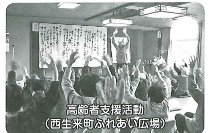
高齢者支援活動(西生来町ふれあい広場)