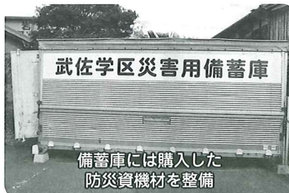
武佐学区災害用備蓄庫