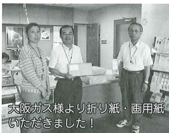
大阪ガス様より折り紙・画用紙いただきました!