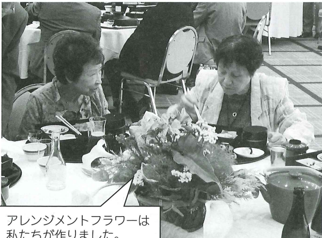
アレンジメントフラワーは私たちが作りました。(ふれまち協力員)