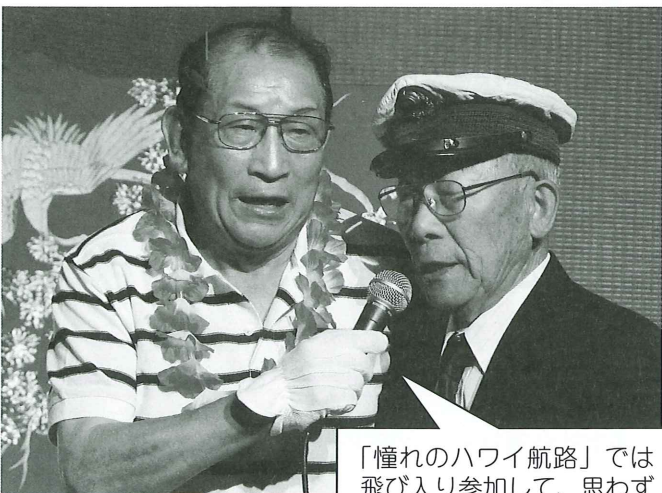
「憧れのハワイ航路」では飛び入り参加して、思わず熱唱♪