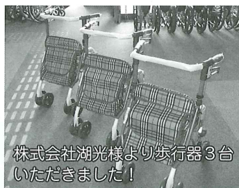
株式会社湖光様より歩行器3台いただきました!