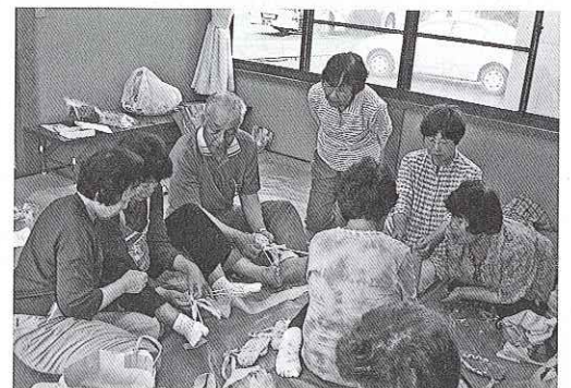
6月のイベント 布ぞうり作りの様子

だれかとお話したい方、家にいることが多いのでどこか出かける所がないかと思われている方など、一度気軽にのぞいてみませんか？