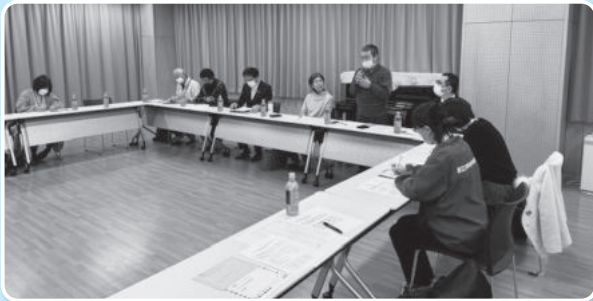
各グループに分かれ、活発な議論がなされました。商い、地域づくり、医療福祉について意見交換を行いました。

1月27日桐原コミュニティセンターにて、ふくしでまちづくり座談会を開催しました。自治会加入率の低下が年々進んでおり、コロナ禍もあいまって、地域のつながりや近所付き合いが希薄化し、困りごとを抱えていても「助けて」と言えない風潮が広がっています。特に桐原学区は最も人口の多い学区であり、急速な少子高齢化で必要な支援が行き届かない人が増えていくことが考えられる中、買い物の課題や金融機関の減少、災害時の避難行動などの生活課題が出てきています。これらの課題を地域住民だけで考えるのではなく、さまざまな関係者と一緒に知恵を出し合い、解決に向けて協働していく場づくりとして座談会を開催したところ、各自治会長、学区まち協、学区民児協、学区社協、地域福祉推進員、見守りグループ代表、桐原コミセン、行政、市社協職員も含め66名もの参加で話し合いを行うことができました。話し合いは分科会形式で実施し、『「商い」と地域のつながりを考える』、『いろいろな人で見守る地域づくりを考える』、『医療福祉施設と地域の新しいつながりを考える』という3つのテーマで5つのグループに分かれ意見交換と話し合いを行いました。また地域の福祉活動者として学校、地域商店、包括支援センター、福祉施設、病院、郵便局、警察、地域活動者も参加され大変有意義な座談会となりました。来年度ふくしでまちづくり座談会の継続を望む声も多く、今後も地域福祉のすそ野を広げていきます。