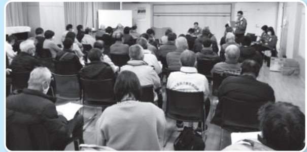
全体会にて、各グループの話し合いで出た課題や意見等を発表しました。