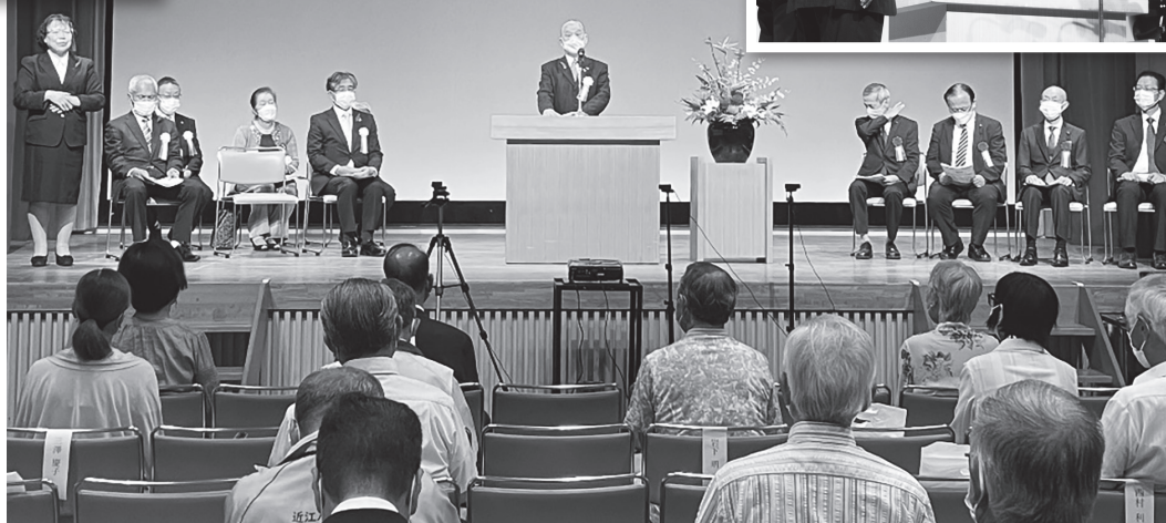
▲地域福祉の推進に今後ともご協力をと髙本会長から挨拶

10月1日、第12回近江八幡市社会福祉大会を開催しました。本大会は、永年本市の地域福祉の発展にご尽力いただいた方々に感謝の意を表するとともに、誰もが安心して暮らせる地域社会を目指して、社会福祉関係者および地域住民が一堂に会し、共感とつながりの輪を広げることを目的としています。