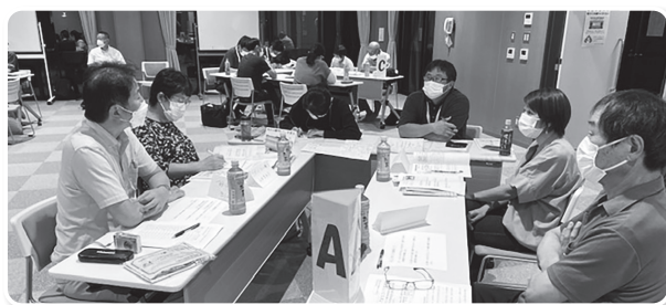
▲福祉に関するテーマごとにグループワーク

ふくしでまちづくり座談会は令和4年度から5年度（上半期まで）にすべての学区で開催予定です。学区の様々な人たちと一緒に、福祉のまちづくりについて対話しませんか？開催スケジュールや詳細は地域福祉課（TEL 31-2677：MAIL ohciiki@gmail.com）まで。