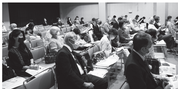
▲シンポジウムの話に聞き入る参加者