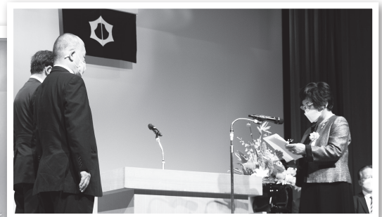
▲これを機に今後も精一杯頑張りますと謝辞