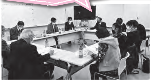
▲福祉教育推進委員会（学校運営協議会） 「子どものころから地域のつながり、学校と地域のつながりを大切にしていきたいです。」

地域住民代表者、福祉関係団体などで構成された福祉教育推進委員会で協議の場を持ちます