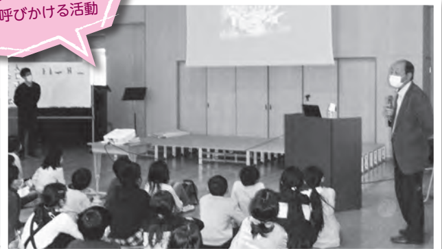
▲朝鮮初級中級学校校長先生のお話を聞き、ふれあい、多文化共生・国際理解の考えを深めました。