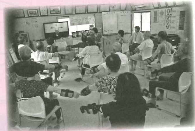
南いきいきクラブ(19区)

ふれあいサロン、 コミュニティカフェ、 いきいき百歳体操… あたらしく地域の居場所が生まれています。