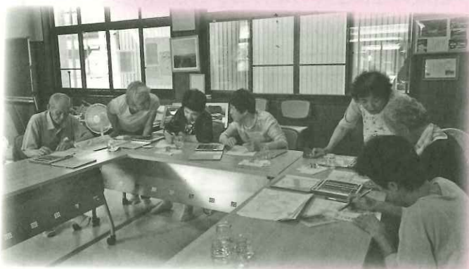
ふれあいサロンなかこもり(中小森町)