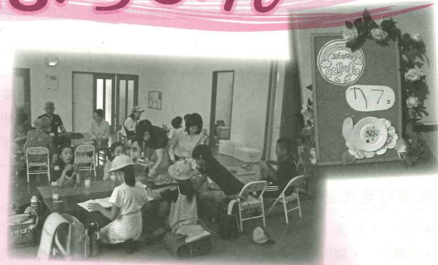
にじのわカフェ(池田本町虹の町)